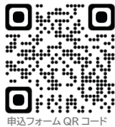
申込フォーム QR コード